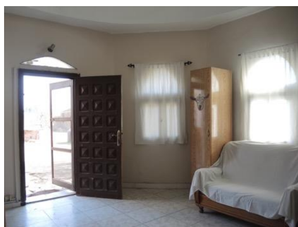
Grosser Raum in Kuppelbau.