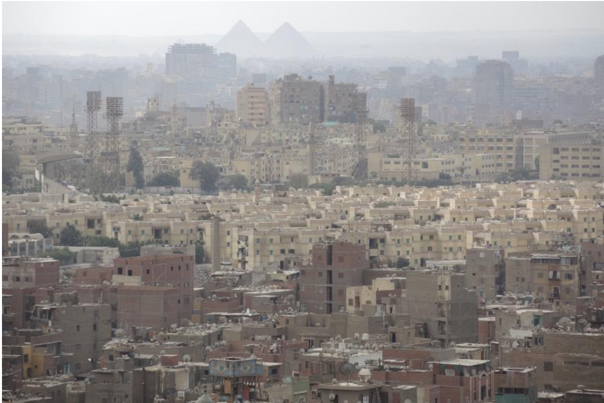
Kairo und die Pyramiden von der Zitadelle (El Qal'a) aus gesehen.

Eine Postzustellung über die Botschaft ist zurzeit nicht mehr möglich. Da die Postzustellung allgemein sehr kompliziert ist, ist von Paketen abzuraten. In dringenden Fällen soll mit Shady Gouda eine kurzfristige Lösung gesucht werden.