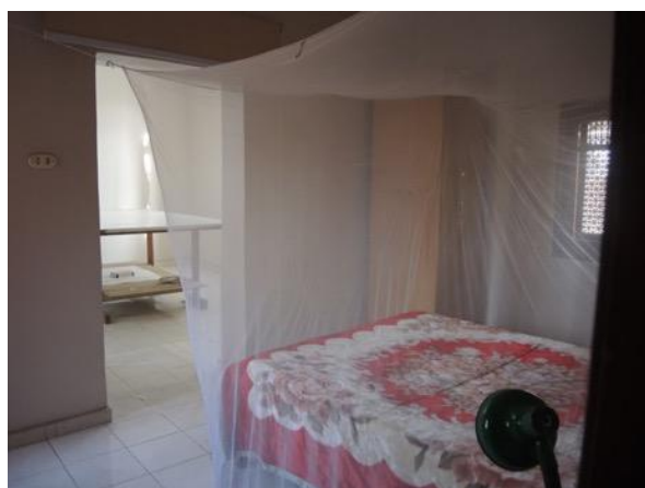
Schlafzimmer mit angrenzendem Atelier.