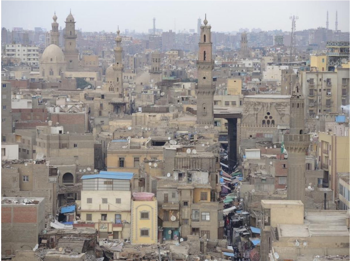
Blick vom alten Stadttor Bab Zuwayla