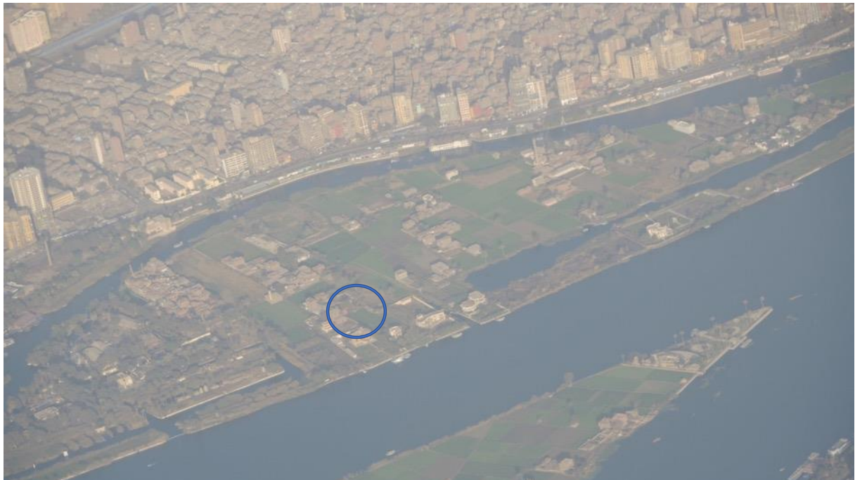
Unten die Insel El Dahab, in der Mitte die Insel El Qursayah mit den Ateliers